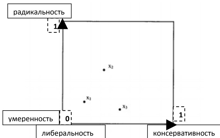
Рис. 1. Сравнение политических идеалов и судебных решений как инструментов для исследования судебной политики 2

Джеффри Т. Лакс приводит две основные модели измерения судебной политики, от которых все иные презюмирует производными – «case space model» и «political space model» 1 . «Political space» является более примитивной формой иллюстрации судейского правосознания, не учитывающей многих особенностей последнего и не приносящей ничего качественно нового в изучение ментальных предпосылок правоприменения. Однако она заслуживает внимания, так как ее постулаты легли в основание другой модели – «case space». Для удобства восприятия каждую из них предлагается отразить на одном рисунке (рис. 1).